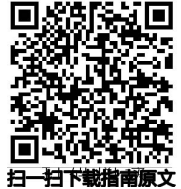
扫一扫下载指南原文